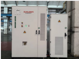
Slovakia OASIS L215 & Power 200kW/215 kWh Outdoor Battery Storage System BESS in Manufacturing