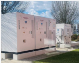
Holland OASIS L215&Power 400kW/430kWh Outdoor Battery Storage System BESS in Manufacturing