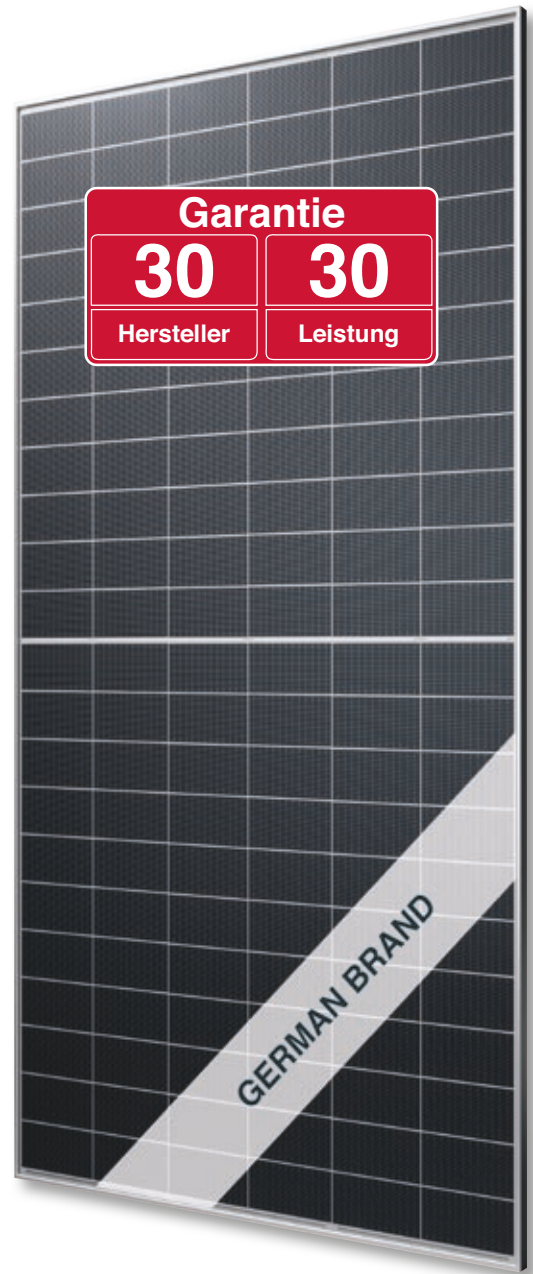
Abb. ähnlich 132TGBDE250217A